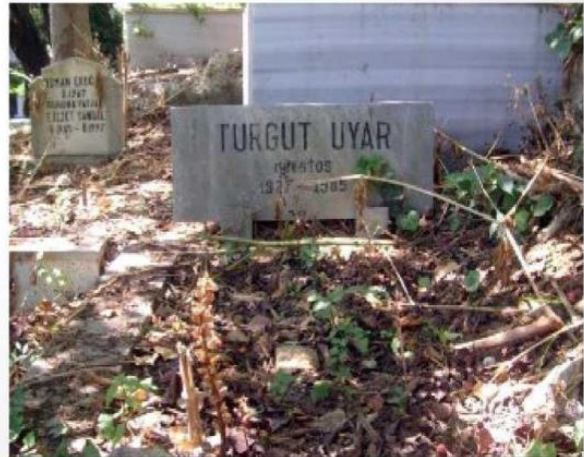
Turgut Uyar Mezarı (1985)

-Gidin gemiler, gidin Vardığınız yerlere selam edin Gün olur bütün kaygılardan uzak Ben de gelirim... (Türkiyem, Varlık Yay., 1952)