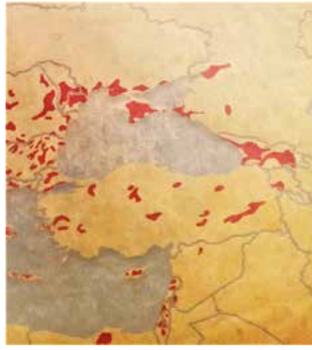
İzmir şarap haritası

tuzları ile ödeniyordu. Daha başta yazmıştım. Benim için çıpra yatağı olan İzmir, Çamaltı Tuzları’ndan çıkarılan tuz gelirleri, Osmanlı borçlarının ödenmesinde önemli bir yer tutuyordu. O nedenle de tuzların haritası vardı.