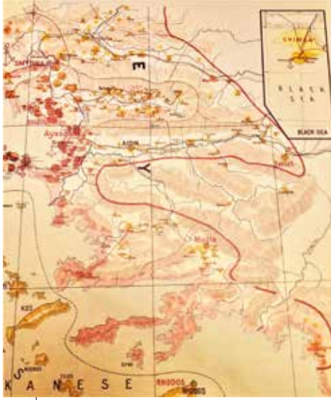
İzmir tütün dikim haritası. 1925

Bu 16. yüzyıl Türk haritacılarının ayrıntılı Ege ve İzmir haritaları vardır. Kitabının kapağının içinde, “Bu harita Ali Macar’ındır. Gaflet olunmaya” notu bulunan Ali Macar Reis’in haritası, İzmir’in yer aldığı en eski Osmanlı haritalarındandır. Kâtip Çelebi’nin, “Cihannüma” isimli kitabında yer alan haritaların birçoğu ise Çelebi’nin kendi çizimi değildir. Matbaa baskısı, 1732 yılında İbrahim Müteferrika tarafından hazırlanırken, Müteferrika tarafından eklenmiştir. Belki de Ali Macar Reis kitabına “bu harita benimdir ha!” notunu koyarken, Müteferrika’ya bir mesaj veriyordu. Kim bilir?