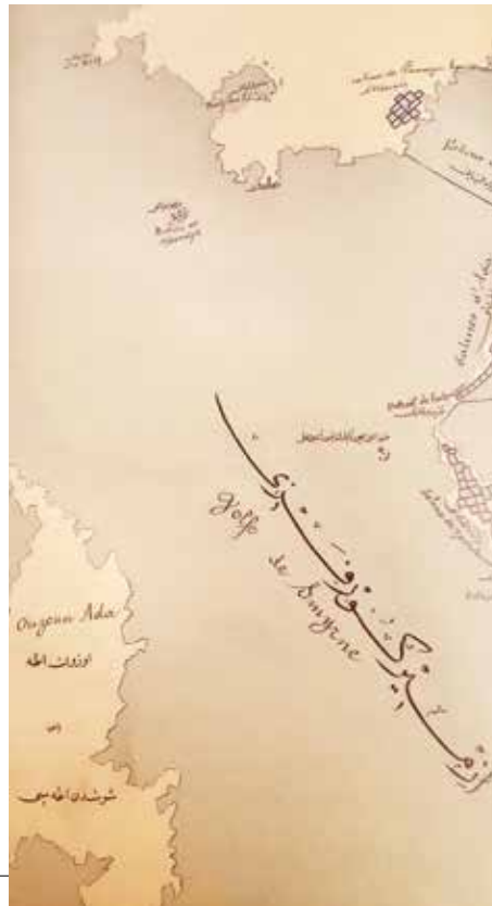
İzmir Tuzları Haritası

İzmir’in şarap haritası bile var. Nasıl olmasın ki? Yaşlı Plinius (Pliny the Elder), “Ana Tanrıça Tapınağı’na yakın