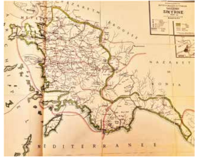
Düyün-ı Umumiyye İzmir Haritası

bir yerde üretilen Pramnos şarabı Smyrna’dan gelmektedir.” der. Plinius’un sözünü ettiği Ana Tanrıça Tapınağı, Kadifekale’deki Artemis Tapınağı’dır.