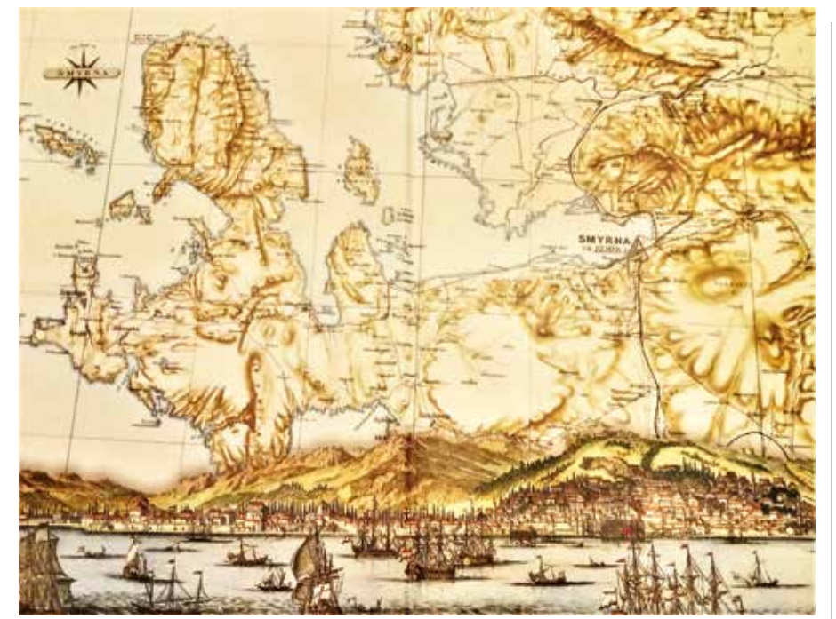
Izmir Körfezi haritası.

... "Tarihte İzmir Haritaları" kitabı, dünyanın resmedilmeye değer Pitoresk kentlerinden İzmir'in... "