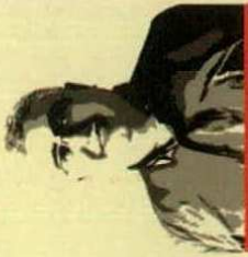
HAYRİ FEHMİ YILMAZ

MS 2. yüzyılda yazılan, Bizans döneminde İstanbul'da kopyalanan dünyanın bilinen en eski harita kitabı, tıpkıbasım olarak Boyut Yayınları tarafından yayımlandı. Eser İstanbul'un fethiyle Fatih tarafından bulunarak korumaya alınmış, sonrasında unutulmuş ve Mustafa Kemal'in emriyle tamir edilerek kurtarılmıştı. Orijinal eser tekrar restore edildi ve tıpkıbasımı yapılarak okurlara kazandırıldı.