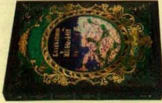
KLAUDİOS PTOLEMAİOS COĞRAFYA EL KİTABI Klaudios Ptolemaios Boyut Yayın Grubu 412 Sayfa, 3.500 TL

Eserin Bizans dönemindeki macerasını bilmek zor. Muhtemelen fethiten sonra Topkapı Sarayı'na getirilmiş ve Fatih Sultan Mehmet'in kütüphanesinde korunmuştur. Bizans başkentinin manastır ve saray kütüphanelerinden bazı yaz-