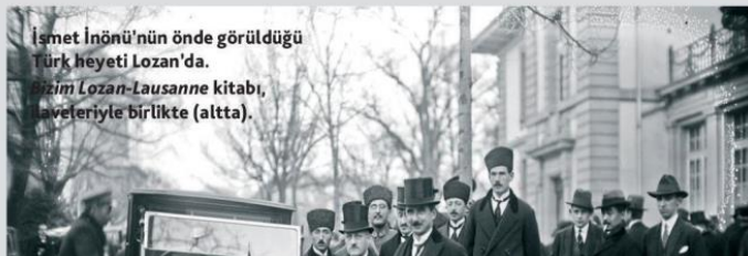
İsmet İnönü'nün önde görüldüğü Türk heyeti Lozan'da. Bizim Lozan-Lausanne kitabı, sayfeleriyle birlikte (altta).

kaybettiği, Lozan'ın bir semtinde, Ouchy'de 1912'de imzalanan anlaşmayla kesinleşti. Çocuk Hakları Bildirgesi Lozan'dan bir yıl sonra Cenevre'de imzalandı. Türkiye, Milletler Cemiyeti'ne üye olma talebini 1932'de Cenevre'de dile getirdi. 1936'da Boğazlar Sözleşmesi, yine Lemane kıyısındaki bir başka kentte; Montreux'de