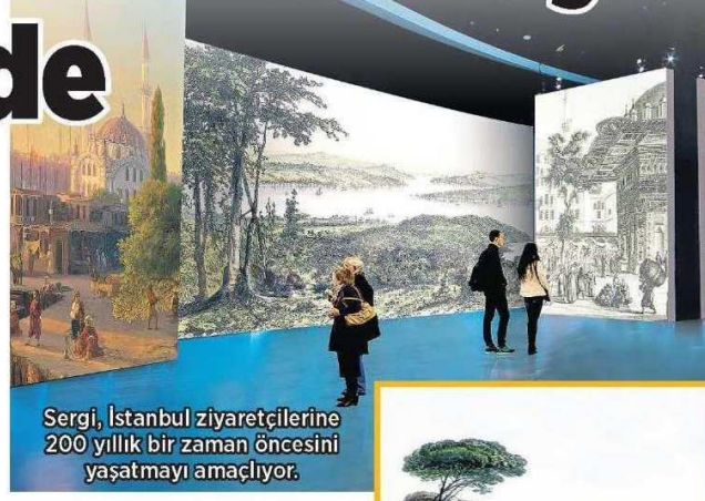
Sergi, İstanbul ziyaretçilerine 200 yıllık bir zaman öncesini yaşatmayı amaçlıyor.

Dijital serginin genel yönetmenliğini Bülent Özukan , müzik