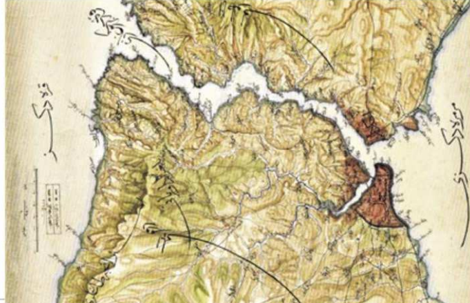
Ali Rıza Bey tarafından yapılan İstanbul Bogazi'nin topografik haritası, 19. yüzyıl sonu, Mektebi Harbiye.

Bogazların eski haritaları güvenilir değildir; ama zaman zaman hızla değişmekte